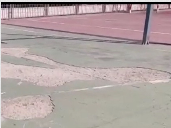
Cancha municipal exterior techada en Vallecas